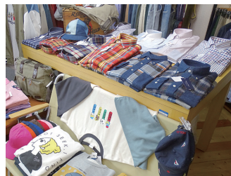
「ケントアヴェニュー」のネルシャツ(チェック)

● Jack&fiero ジャック アンド フィーロ 住所：大手 2-17-16 信濃ビル 201 定休日：水曜日 営業時間：11：00～19：00 電話番号：050-8890-5116