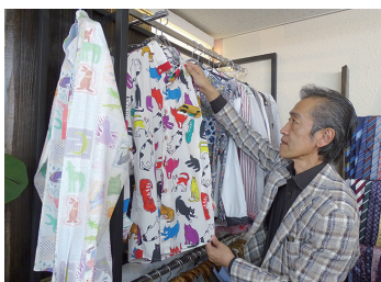
河谷シャツは一点物も扱っています

当店らしく、面白い商品をご用意できているのではないかなという自信もあります。落ち着いた雰囲気の中で、楽しみながら選んでいただけると嬉しいです。