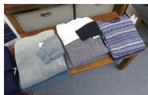
インディゴ染めの日本製リネニット

商品を気に入っていただけただけの時、またご来店して下さった時、オーダーをされたお客さまに完成したものをお渡しして喜んでいただけた反応を見る瞬間が一番嬉しいです。