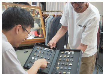
セミオーダースーツのボタン選び。既製品に比べて体に合うものでフルオーダーより価格も抑えられる、セミオーダーならではの良さです。

接客が好きで旧八ヶ岳リゾートアウトレットでケントアヴェニューの代理店を二十数年間営業し、3年前に独立。メンズ・レディースカジュアル、セミオーダースーツを取扱うセレクトショップを営業していました。アウトレットの閉業に伴い、急遽移転先を探していたところ、今の物件と出会いました。綺麗な店舗に加えてオーナーさんや管理人さん、同じビルのテナントさんの人柄に惹かれ諏訪での営業を決めました。