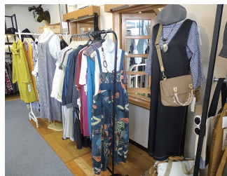
レディースは素材にこだわった着心地のよいものやインポート・百貨店商品など幅広く扱っている。

諏訪市の発行するお得で SUWA プレミアム付応援券の利用店に登録しています。12月から利用が開始しますので是非お気に入りの一着を探しにご来店ください。