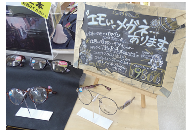
POPはスタッフ全員で作成

当店では得意、不得意にかかわらずスタッフ全員でPOPの制作を行っています。例えば、とても需要が高く現在キャンペーン中の「パソコン・スマホなど手元の見え方が楽になる『スマホメガネ』」や、当社が商標登録している「県民メガネ」など、その時期に行っているキャンペーンやお勧めする商品のPOPです。商品の良さを的確に伝えながら当店らしさを演出することで、お客様の購買や満足に繋がり、スタッフのやりがいになっていると思います。