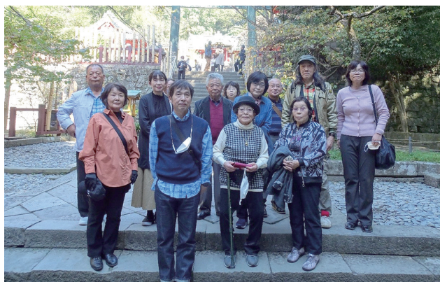
久能山東照宮にて

参加者からは「久しぶりに遠方までの旅行を楽しむ事が出来た。親睦を図る良い機会になった。」などの感想が寄せられました。