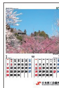
新築の梅林と好文亭/茨城