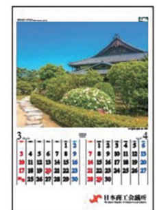
春の玉置公園 社務所庭園/香川