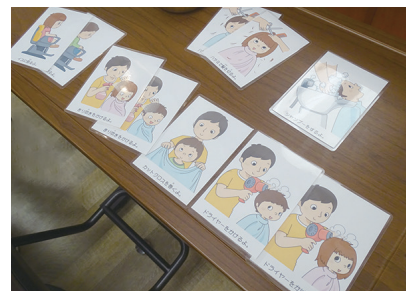
何をするのが目で見てわかる絵カード

今年の4月からは改正障害者差別解消法が施行され、障害者への合理的配慮は義務化されます。今後はどのお店にとっても無関係ではなくなってきます。スマイルカットの取組みにご興味がありましたら、ぜひお問い合わせください！