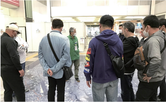
床に描かれている福岡市内の街並みを見ながら説明を聴く参加者

当所青年部は、福岡・博多の歴史や文化、まちづくりの特徴や変容などを、地元のガイドさんに解説していただきながら学びました。また、天然とんこつラーメン専門店 一蘭の工場の見学をし、参加した青年部会員それぞれが自社の事業活動などに対してのヒントを得ることができました。