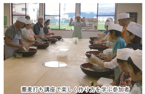
蕎麦打ち講座で楽しく作り方を学ぶ参加者