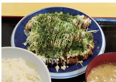
● お好み焼き風のバラかつ定食

当店自慢のお好み焼き風のバラかつ定食も「こうすればおいしいかな？」と試行錯誤して生