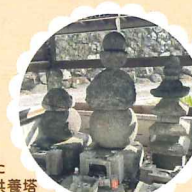
北条時行と鎌倉を奪還した諏訪頼重公の供養塔