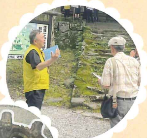
まちなか観光案内人の案内で見学